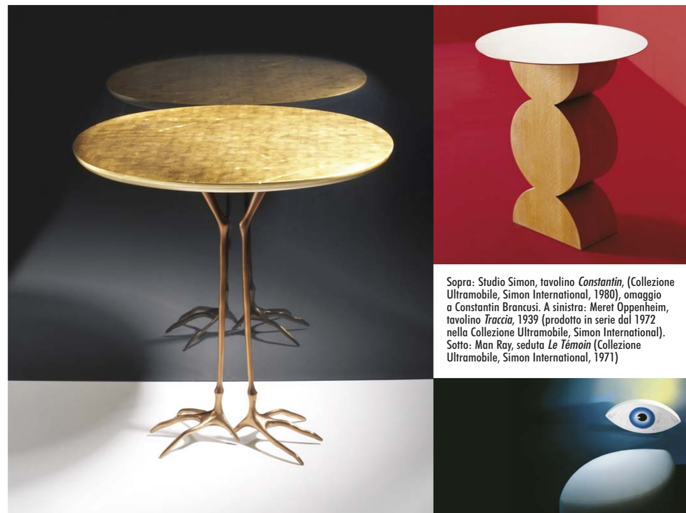
Sopra: Studio Simon, tavolino Constantin , (Collezione Ultramobile, Simon International, 1980), omaggio a Constantin Brancusi. A sinistra: Meret Oppenheim, tavolino Traccia , 1939 (prodotto in serie dal 1972 nella Collezione Ultramobile, Simon International). Sotto: Man Ray, seduta Le Témoin (Collezione Ultramobile, Simon International, 1971)