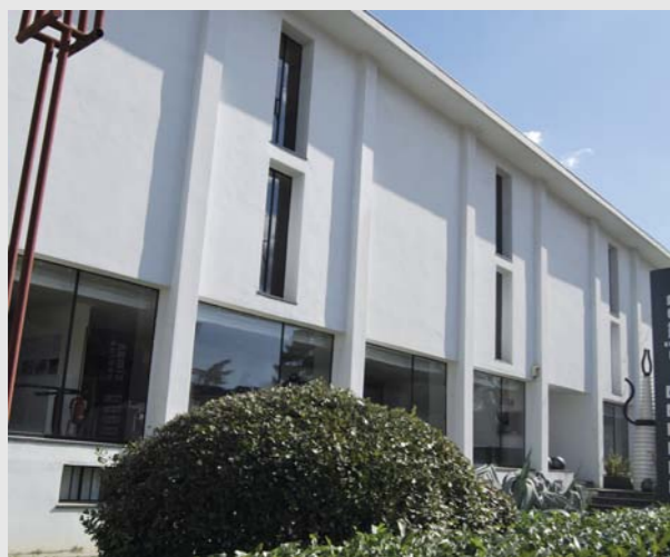
Nelle foto: esterno e interno dello Showroom Simon a San Lazzaro