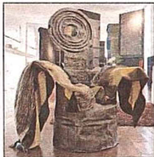
“Simon Spazio per le idee”: 2600 metri quadrati sulla via Emilia

I cinque colori, equivalenti ai cinque sensi, ritornano sul marchio, il “Malitte”, stilizzato: una